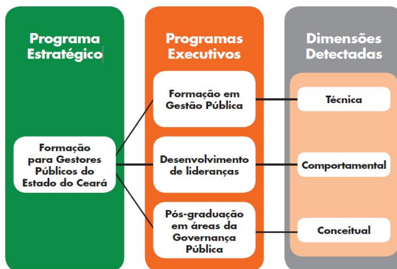
Figura 2 – Desenho Programa Estratégico

Ainda em 2016, desenha-se o Programa Estratégico de Formação para Gestores Públicos do Estado do Ceará – PEFGP , composto por ações a serem desenvolvidas em 3 eixos: Gestão Pública, Desenvolvimento de Lideranças e Governança Pública. A cada eixo corresponde um Programa Executivo composto por diferentes ações de capacitação.