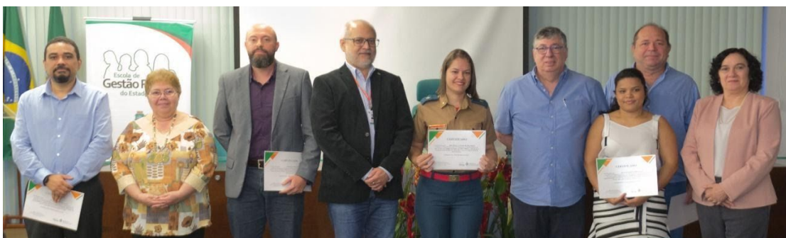
Figura 3 - Evento de Certificação do Programa Executivo de Formação em Gestão Pública – 2018

A Gestão para Resultados é o atual modelo de gestão do Estado do Ceará e o curso anteriormente referido objetiva favorecer a compreensão do conceito de Gestão para Resultados aplicado na implementação das políticas públicas, enfatizando avanços, desafios, status atual e próximos passos. Já o curso de Liderança e Autodesenvolvimento visa desenvolver competências necessárias à liderança no setor público.