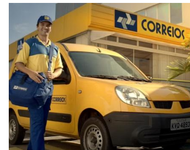
Gestão de Materiais Almoxarifado