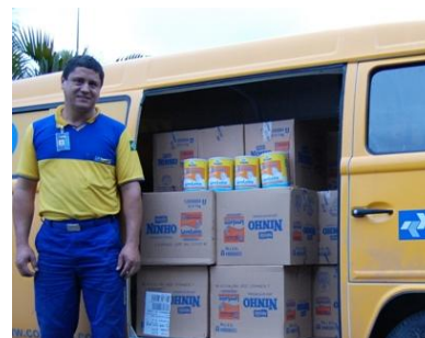
Leve Leite e Remédio em Casa