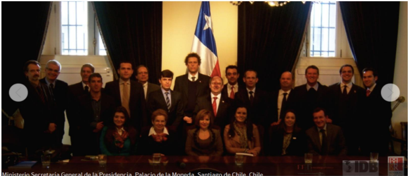
Ministerio Secretaría General de la Presidencia, Palacio de la Moneda, Santiago de Chile, Chile