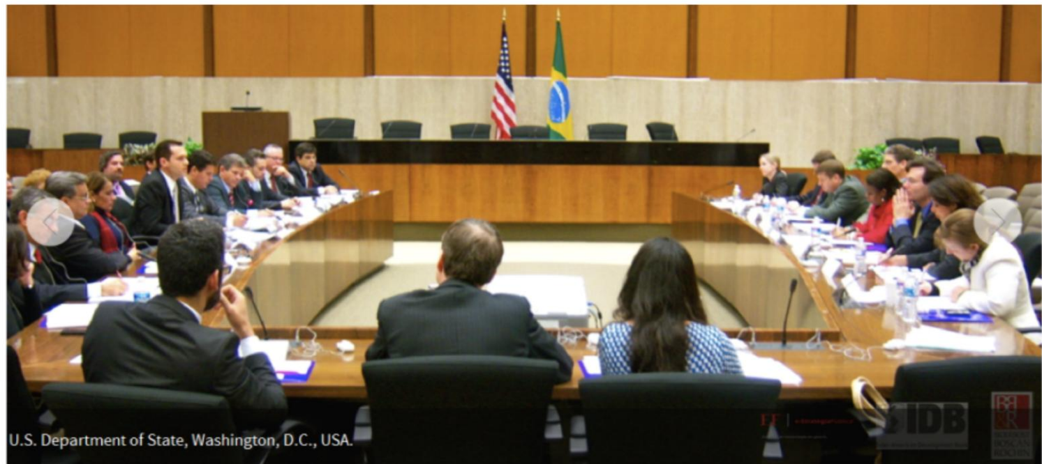
U.S. Department of State, Washington, D.C., USA.