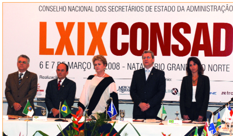
Abertura do LXIX Fórum do Consad em Natal (RN)

finalidade do Conselho representa o desafio de todos na construção da ponte da gestão pública, principalmente neste fórum que irá desenhar a ponte maior, que é o planejamento estratégico do Consad.