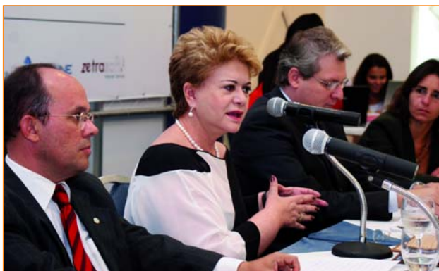
Wilma Maria de Faria - Governadora do Rio Grande do Norte