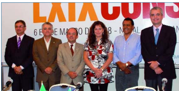
Nova diretoria do Consad

Peço licença para ainda escrever este editorial para vocês. Por meio dele estou me despedindo da presidência do Consad, na qual estive por dois mandatos. Período em que, tenho a satisfação e a tranquilidade de afirmar, muitos avanços aconteceram. O Consad caminhou muito desde que faço parte deste órgão e tenho certeza de que agora, sob esta nova presidência, irá continuar caminhando e seguindo todos os passos que foram traçados. Conseguimos,